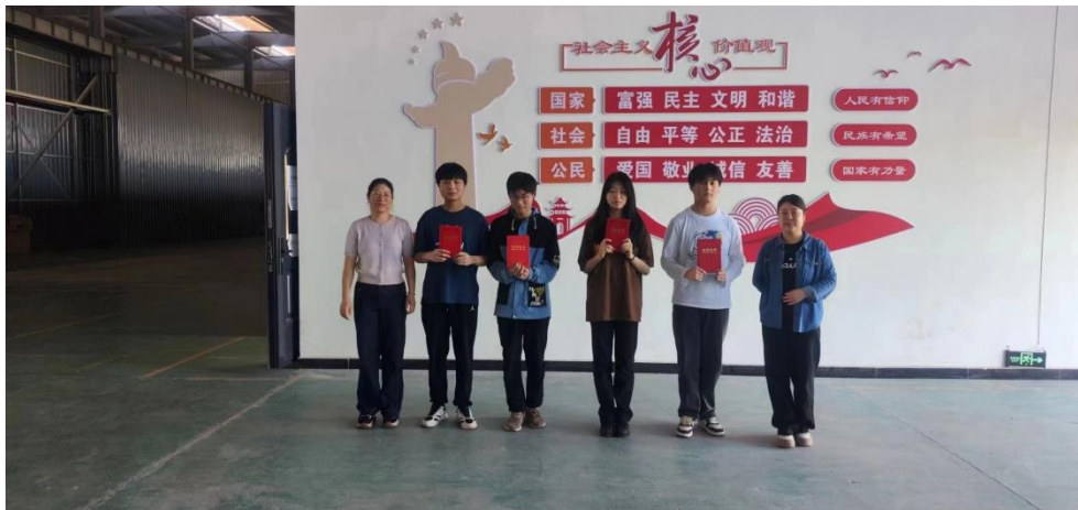
XIAOMI 12S ULTRA

23mm f/1.9 1/100s ISO250 2024.05.14 15:38:01