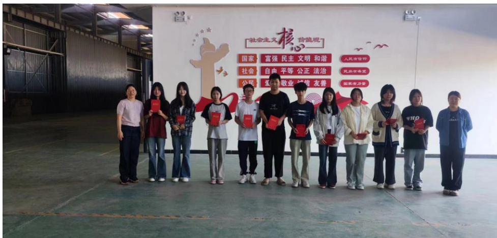
XIAOMI 12S ULTRA

23mm f/1.9 1/100s ISO250 2024.05.14 15:38:01