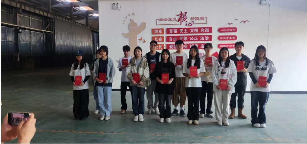
XIAOMI 12S ULTRA