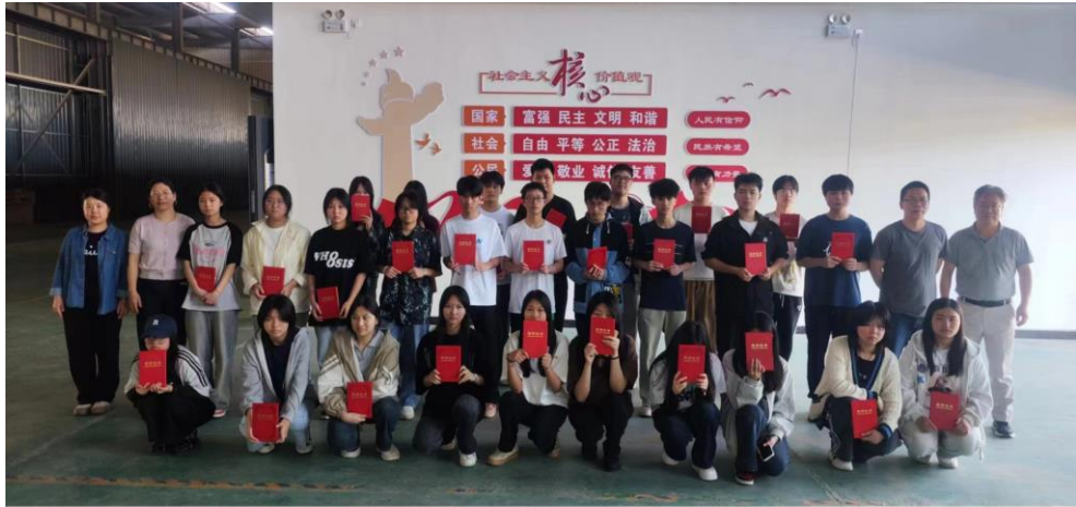
XIAOMI 12S ULTRA